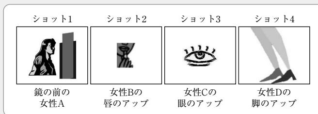
図1 クレシヨフ効果: 創造的人間

図1のような別の女性のショット1からショット4までをつなぐと、各ショットは別の女性であるにもかかわらず一人の同じ女性が化粧をし、靴を履く行動をイメージします。